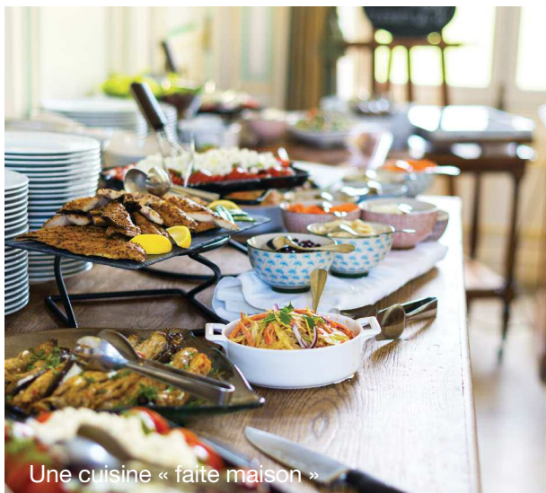
Une cuisine « faite maison »

La salle à manger baignée de lumière s'étend sur 1000 m 2 . Telle une terrasse, elle profite d'immenses baies vitrées et d'une hauteur sous plafond exceptionnelle. Les petits déjeuners, casse-croûtes, déjeuners, goûters, cocktails ou dîners d'affaires rythment les réunions professionnelles jusqu'à 200 participants. Le Chef de cuisine en véritable chef d'orchestre propose une table authentique et généreuse 100% « fait maison » à base de produits frais et de saison.