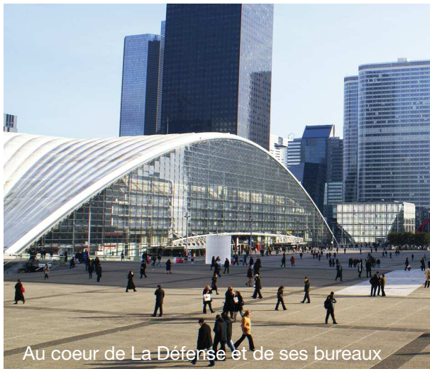
Au coeur de La Défense et de ses bureaux

Octobre 2014, Châteauform' City le Cnit ouvre ses portes sur près de 3000 m 2 d'espaces consacrés à l'organisation de séminaires et de réunions d'entreprise. Equipés des dernières technologies, les 10 salles de réunion et les 5 salons offrent aux participants une nouvelle expérience de travail résolument high-tech. Les séances de brainstorming prennent une autre dimension devant le mur d'écran tactile MultiTouch. Située directement sous la grande voûte du Cnit, véritable prouesse architecturale des années 50, la maison est aménagée et décorée dans un esprit loft londonien des fifties.